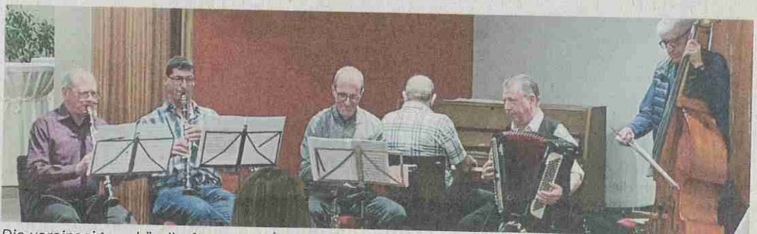
Die vereinseigene Ländlerformation in Aktion.